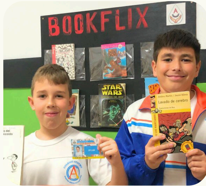
ANIMACIÓN A LA LECTURA