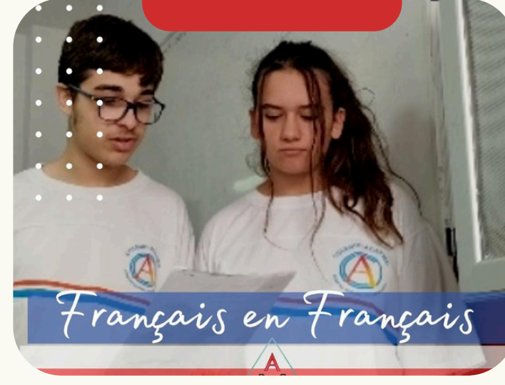
Français en Français