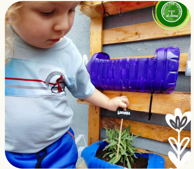
THERE IS NO PLANET B