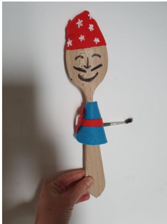
Ilustración 1: Marioneta hecha con una cuchara de madera

También podemos representar la historia de manera teatralizada. Buscar en casa o crear objetos que nos ayuden a ello.